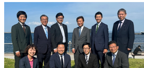
よこすか未来会議の仲間たち

横須賀市議会会派「よこすか未来会議」と共に行動し、県と市の連携でしっかりと政策を前に進めていきます。